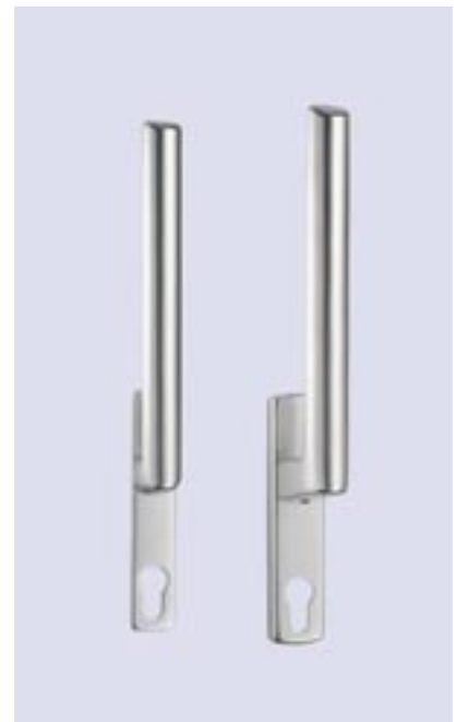
Hebel innen und außen abschließbar