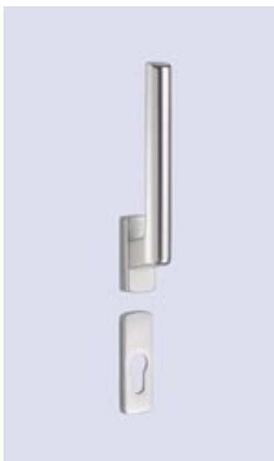
Getriebe abschließbar mit Profilzylinder