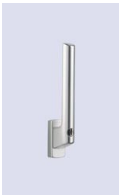
Hebel abschließbar mit Drehzylinder