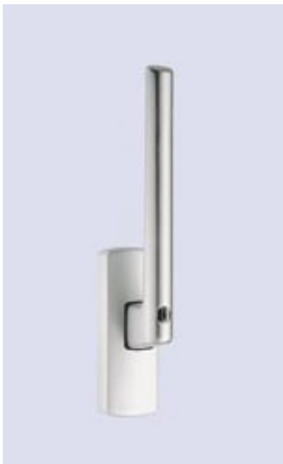
Hebel abschließbar mit Drehzylinder