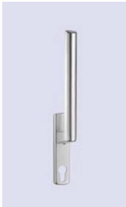
Getriebe abschließbar mit Profilzylinder