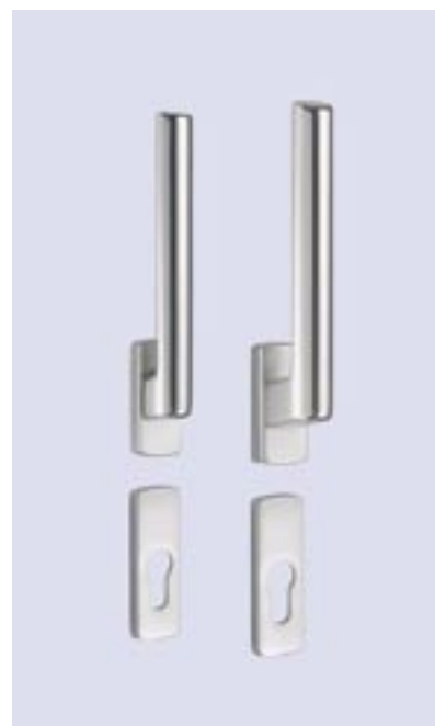
Hebel innen und außen abschließbar